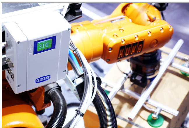
Pompa elettrica compatta GCPI per la movimentazione di scatole di cartone