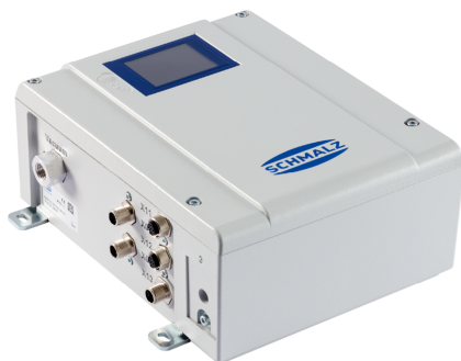
Pompa elettrica compatta GCPI